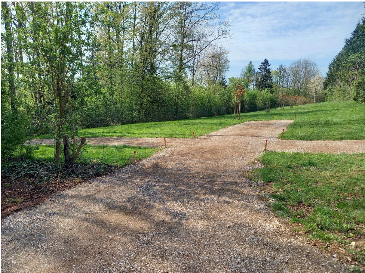
Muslimisches Grabfeld auf dem Friedhof Seesen.

Internet https://www.stadtverwaltung-seesen.de