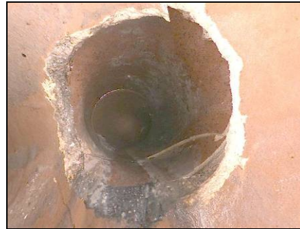
Beispiel für Schadensbild „Riss“

Die Schadensrate bei Leitungen auf privaten Grundstücken wird aufgrund von Erhebungen in verschiedenen Städten und Gemeinden zwischen 40 und 80 Prozent eingeschätzt. Schadensbilder sind vor allem Lageabweichungen, Risse bis zum Totalschaden und Abflusshindernisse.